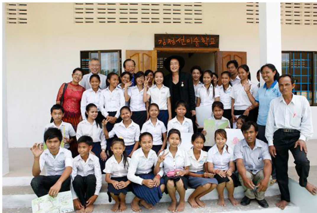
<김중만아트 스쿨 설립>