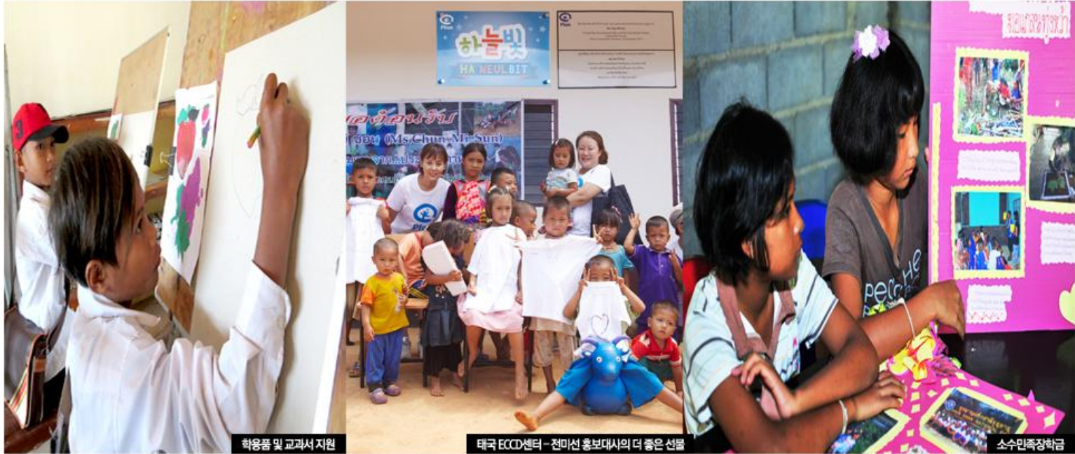
학용품 및 교과서 지원