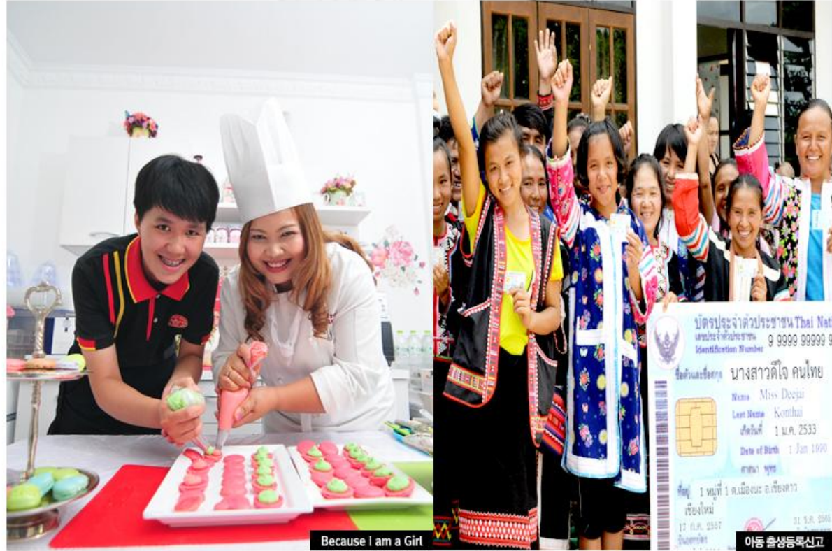
Because I am a Girl