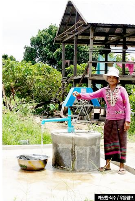
깨끗한 식수 / 우물펌프