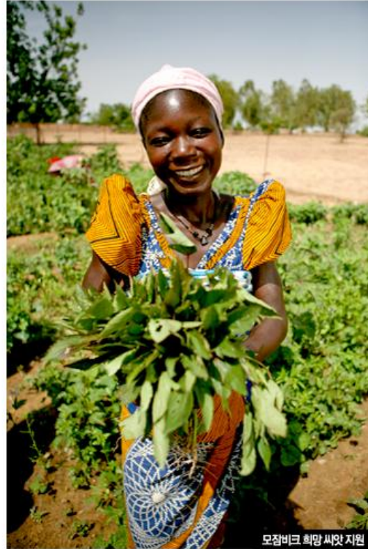
모잠비크 희망 씨앗 지원