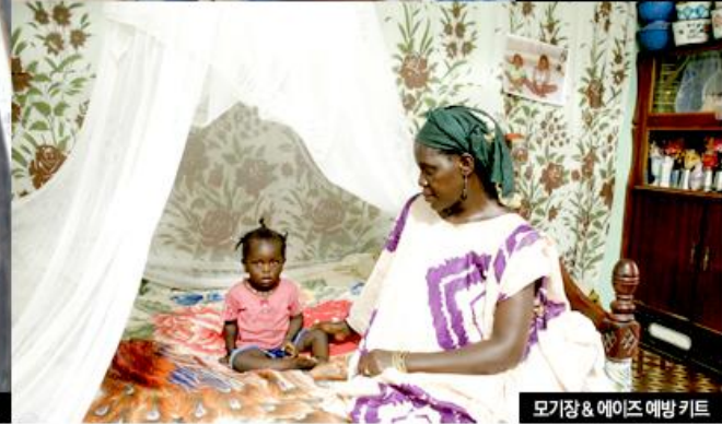
모기장 & 에이즈 예방 키트