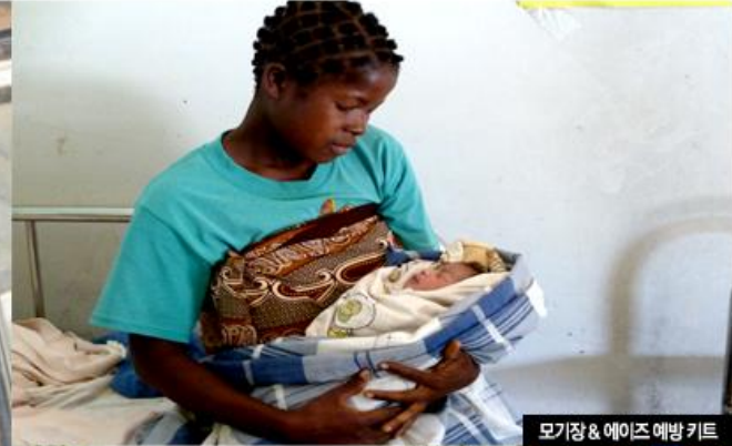
모기장 & 에이즈 예방 키트