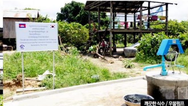
깨끗한 식수 / 우물펌프