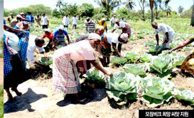
모잠비크 희망 씨앗 지원