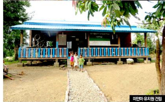
미안마 유치원 건립